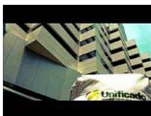
Comercial "15 mil cliques".

Depois de uma série de campanhas para divulgar seus produtos, o Unificado está veiculando um comercial institucional criado pela TIF Comunicação. A peça traz o conceito "Tem algo que sempre vai estar com você, não importa onde você esteja: educação", o filme tem 30 segundos de duração e mostra uma pasta do Unificado em diversas locações. As cenas foram selecionadas dentre 15 mil fotografias e vídeos preparados para a produção da campanha.