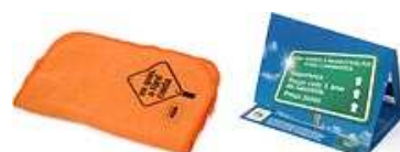
Mala-direta e flanela.

A OpusMúltipla Comunicação Integrada desenvolveu uma campanha para a Ford Caminhões, com o objetivo de incentivar caminhoneiros e frotistas a levarem seus veículos nas oficinas autorizadas da marca em todo o Paraná. Com o mote "Eu guio, a Ford cuida", a ação inclui anúncios em jornais, spots de rádio, mala-direta e E-mail marketing para frotistas, e flanelas de brinde e adesivos de cabine para motoristas.