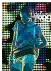
Curitiba Deluxe número 9.

A edição número 9 da Curitiba Deluxe, que começou a circular nesta semana, inaugura a parceria formalizada pela revista com o portal Ponnei.com para a produção de editoriais de moda no Paraná. A capa e duas páginas internas da publicação já trazem o resultado do acordo, que pode ser conferido também no endereço www.ponnei.com .