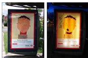
Mobiliário urbano de dia e à noite.

A campanha "Natal no Palácio Encantado", criada pela JWT Curitiba para o HSBC, conta com um projeto especial de mobiliário urbano veiculado pela Clear Channel em Curitiba. Com o mote "Natal do HSBC. Noite feliz. E dia também", diversas peças espalhadas pela cidade mostram, durante o dia, a ilustração de menino estudando. À noite, o mesmo menino aparece cantando e vestindo o figurino do coral infantil do banco. Tinta blackout foi aplicada no verso do cartaz para causar o efeito que muda a boca e roupa do menino e faz aparecer notas musicais na peça quando as luzes do equipamento são acesas. A veiculação vai até o próximo domingo, 16 de dezembro.