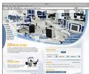
Site da Flexiv.

A Flexiv colocou no ar seu novo site, desenvolvido pela On Solution. O endereço www.flexiv.com.br traz informações sobre a empresa de móveis de escritório, suas linhas de produtos, cases, releases, além de spots de rádio e vídeos institucionais. O novo site conta com uma área dirigida a arquitetos, com informações e imagens de projetos, e uma seção sobre o Estúdio Flexiv de Design, departamento de inteligência interna da indústria, responsável pela criação e lançamento de produtos.