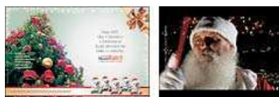
Anúncio e comercial.

A LCT Comunicação criou a campanha de Natal do Shopping Novo Batel, de Curitiba. As peças divulgam a promoção realizada pelo empreendimento para incentivar as compras de fim de ano: a cada R$ 300,00 gastos em lojas do shopping até o dia 5 de janeiro de 2008, o cliente ganha um ursinho de pelúcia exclusivo (enquanto durar o estoque de 400 peças) e um cupom para participar de um concurso cultural. Respondendo à pergunta "Por que o Shopping Novo Batel tem o natal mais charmoso da cidade?", o cliente concorre a cinco viagens internacionais. Os autores das cinco melhores frases ganharão passagens aéreas para Lisboa, Roma, Paris, Londres ou Nova York. A campanha traz a mensagem "Que o encanto e harmonia se façam presentes em todos os corações" e tem como carro-chefe o comercial "O maestro", que mostra o Papai Noel "regendo" a iluminação das lojas e da decoração natalina do Novo Batel.