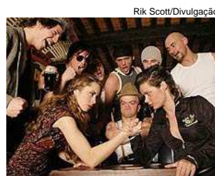
Trabalho do fotógrafo belga Rik Scott mostra a força das mulheres em uma queda-de-braço