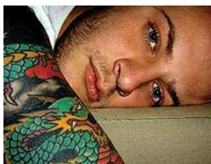
Tatuagem é tema de trabalho fotográfico do coletivo ponnei, que une arte, moda e design

"ponnei.com", endereço do site da turma.