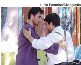
Homens dançam tango em La Boca, bairro para "turista ver", em Buenos Aires, na Argentina