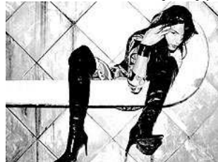
Modelo Maira Becke (Nass Models) em ensaio "Antes do Fim", do coletivo ponnei.com